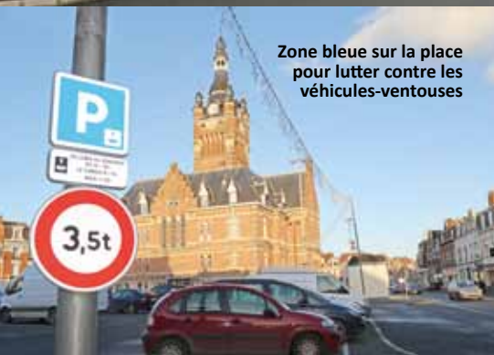
Zone bleue sur la place pour lutter contre les véhicules-ventouses