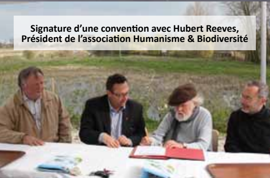
Signature d'une convention avec Hubert Reeves, Président de l'association Humanisme & Biodiversité