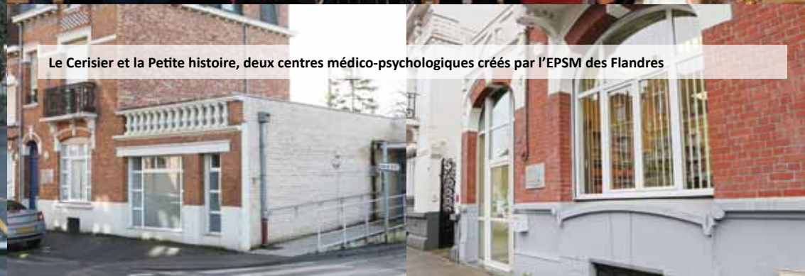
Le Cerisier et la Petite histoire, deux centres médico-psychologiques créés par l'EPSM des Flandres