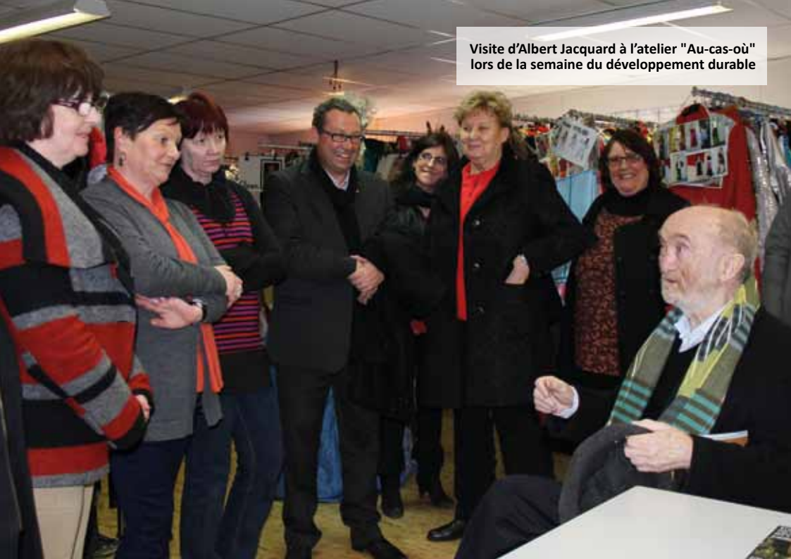
Visite d'Albert Jacquard à l'atelier "Au-cas-où" lors de la semaine du développement durable