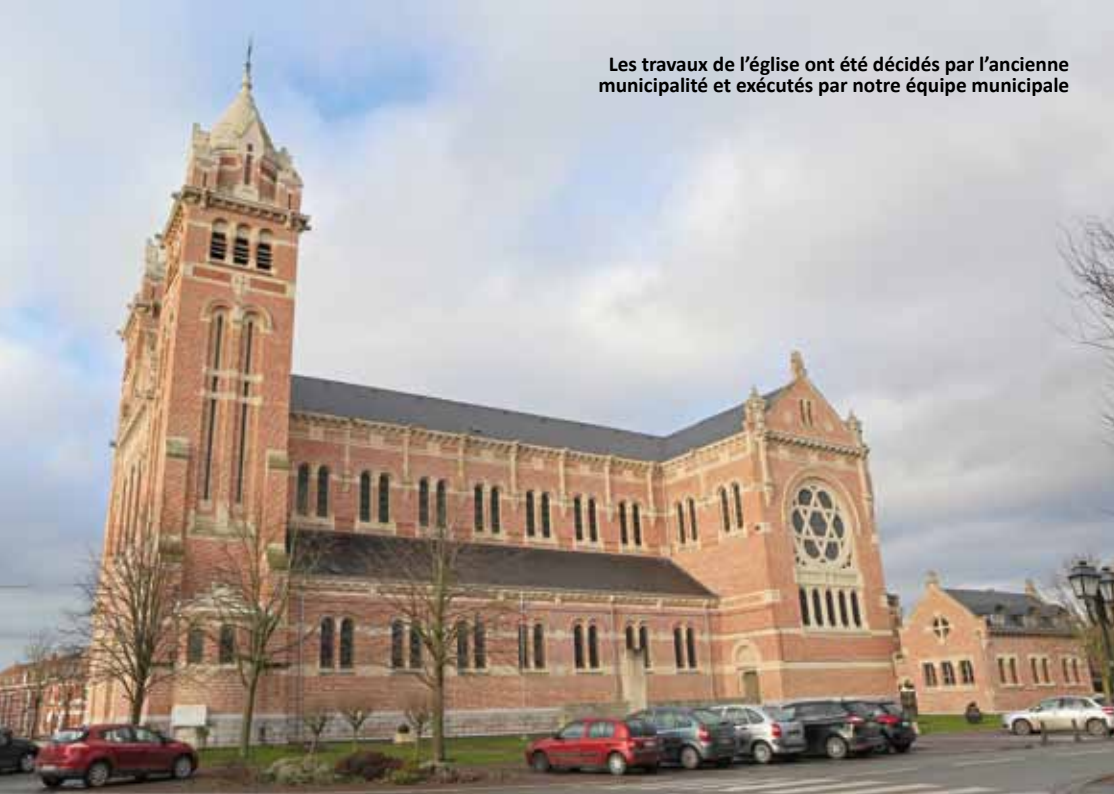
Les travaux de l'église ont été décidés par l'ancienne municipalité et exécutés par notre équipe municipale