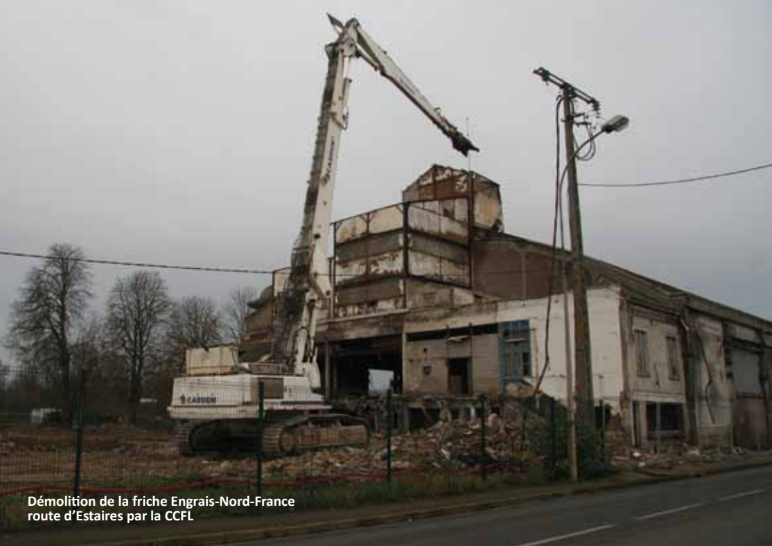
Démolition de la friche Engrais-Nord-France route d'Estaires par la CCFL