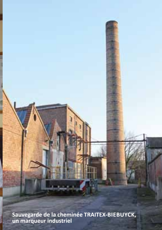
Sauvegarde de la cheminée TRAITEX-BIEBUYCK, un marqueur industriel