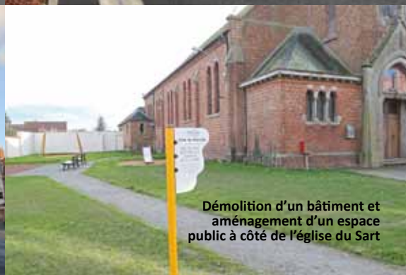
Démolition d'un bâtiment et aménagement d'un espace public à côté de l'église du Sart