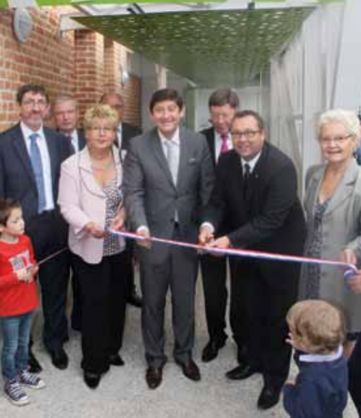
Inauguration du multi-accueil avec le Président du Conseil Général du Nord