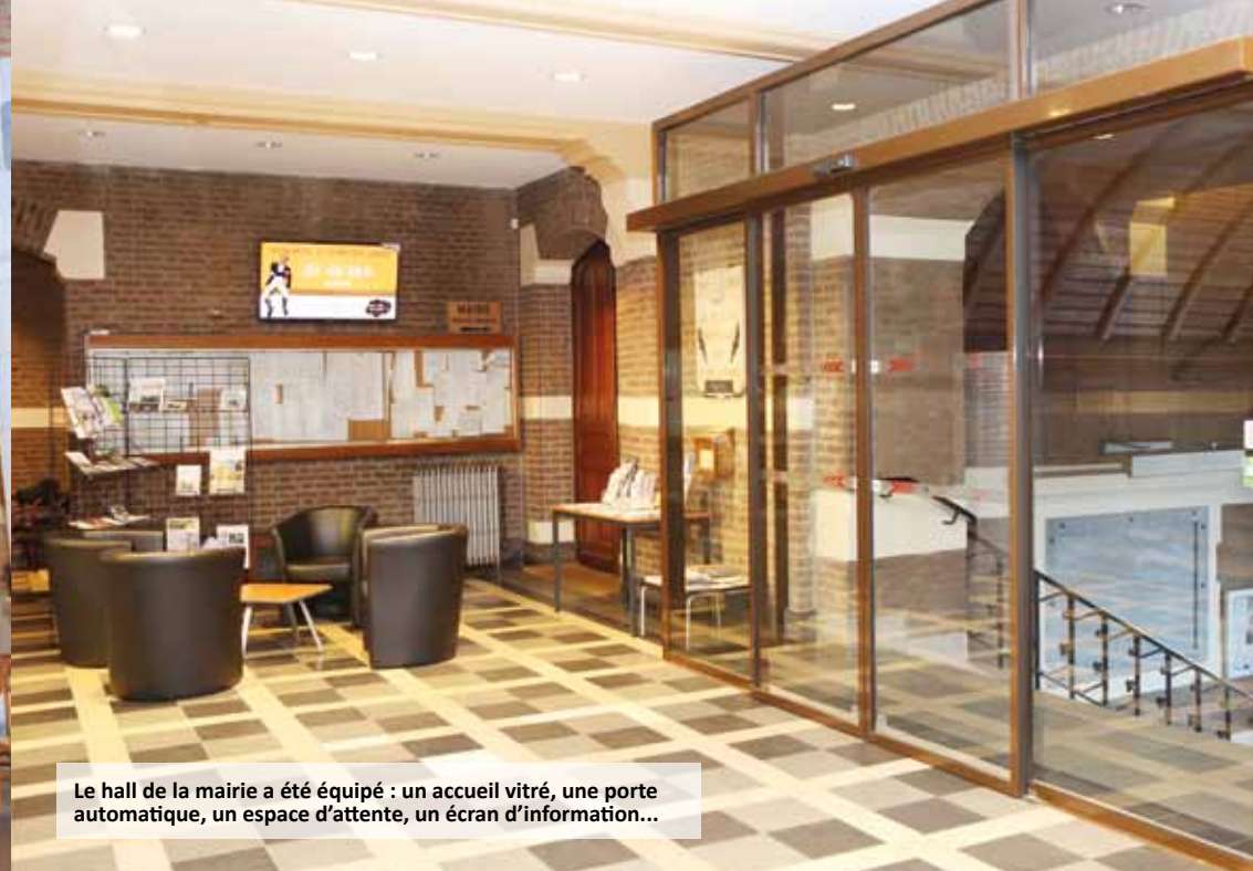
Le hall de la mairie a été équipé : un accueil vitré, une porte automatique, un espace d'attente, un écran d'information...