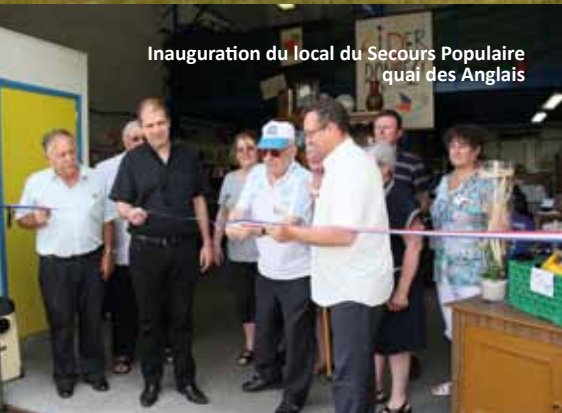
Inauguration du local du Secours Populaire quai des Anglais