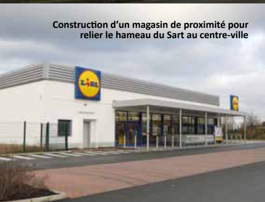
Construction d'un magasin de proximité pour relier le hameau du Sart au centre-ville