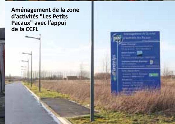
Aménagement de la zone d'activités "Les Petits Pacaux" avec l'appui de la CCFL