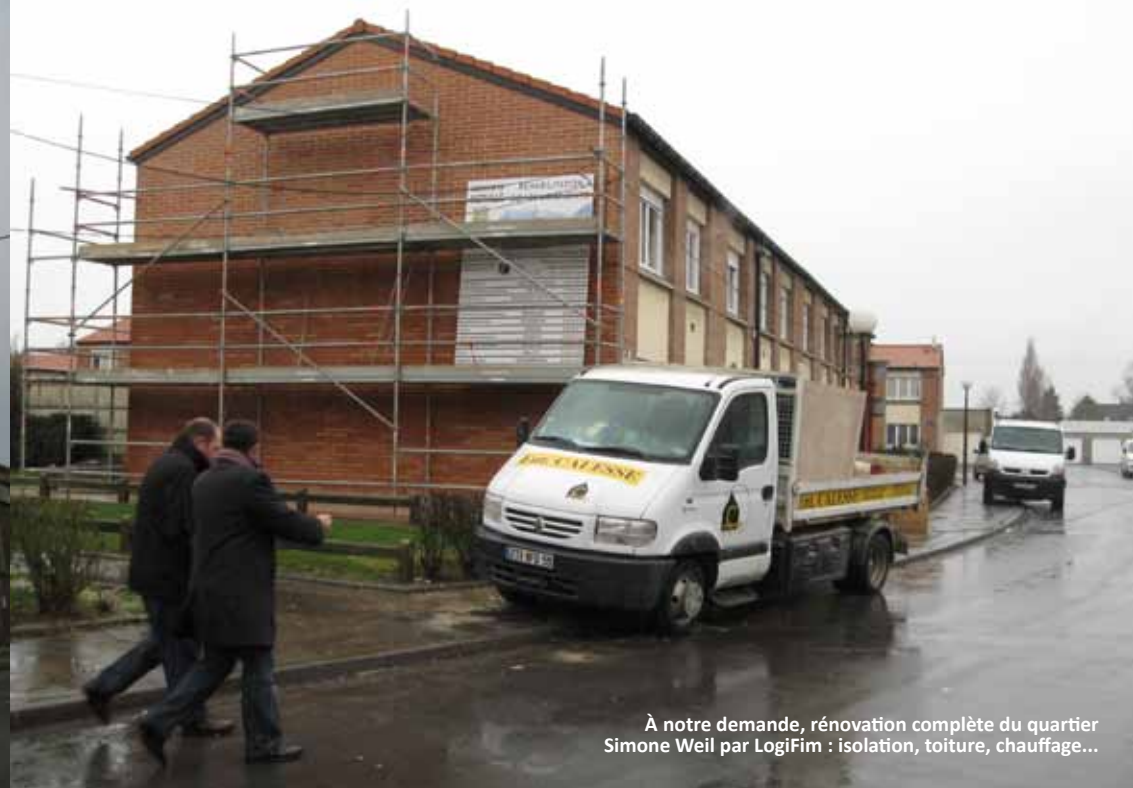
À notre demande, rénovation complète du quartier Simone Weil par LogiFim : isolation, toiture, chauffage...