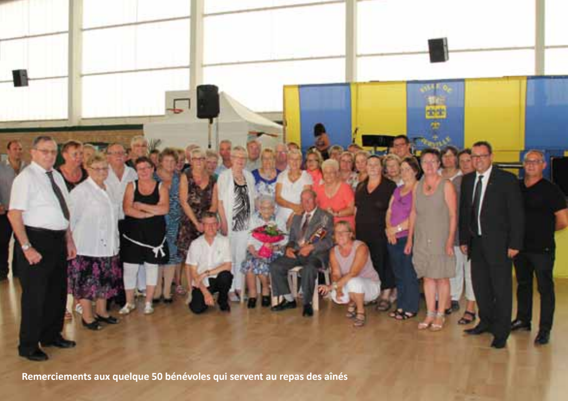
Remerciements aux quelque 50 bénévoles qui servent au repas des aînés