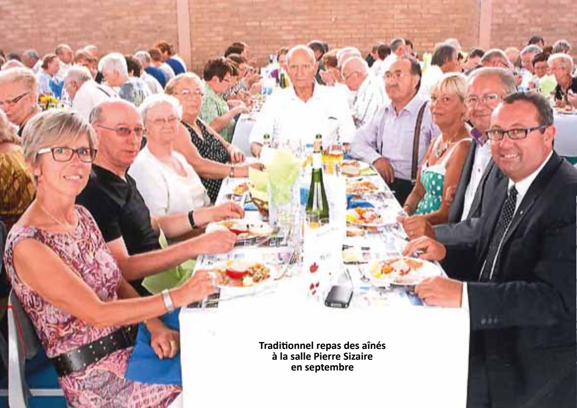
Traditionnel repas des aînés à la salle Pierre Sizaire en septembre