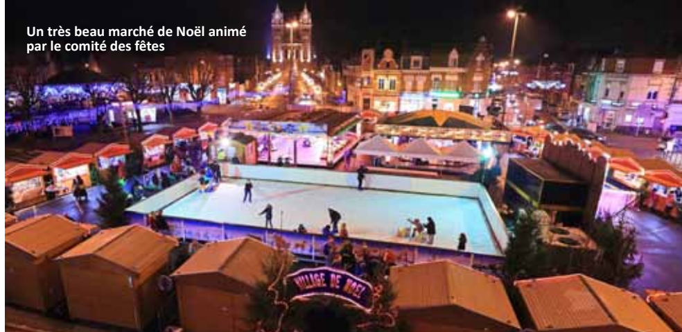
Un très beau marché de Noël animé par le comité des fêtes