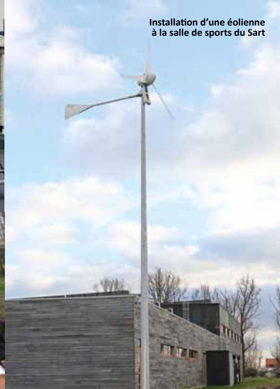
Installation d'une éolienne à la salle de sports du Sart