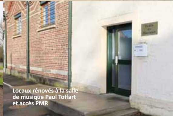
Locaux rénovés à la salle de musique Paul Toffart et accès PMR