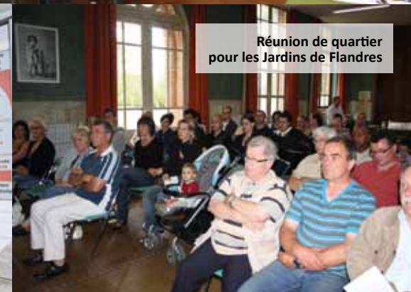
Réunion de quartier pour les Jardins de Flandres