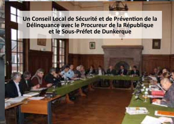
Un Conseil Local de Sécurité et de Prévention de la Délinquance avec le Procureur de la République et le Sous-Préfet de Dunkerque