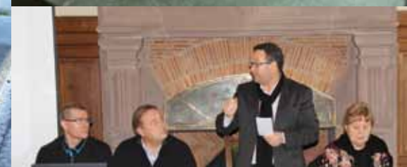
Réunion avec les créateurs d'une coopérative en éco-rénovation...