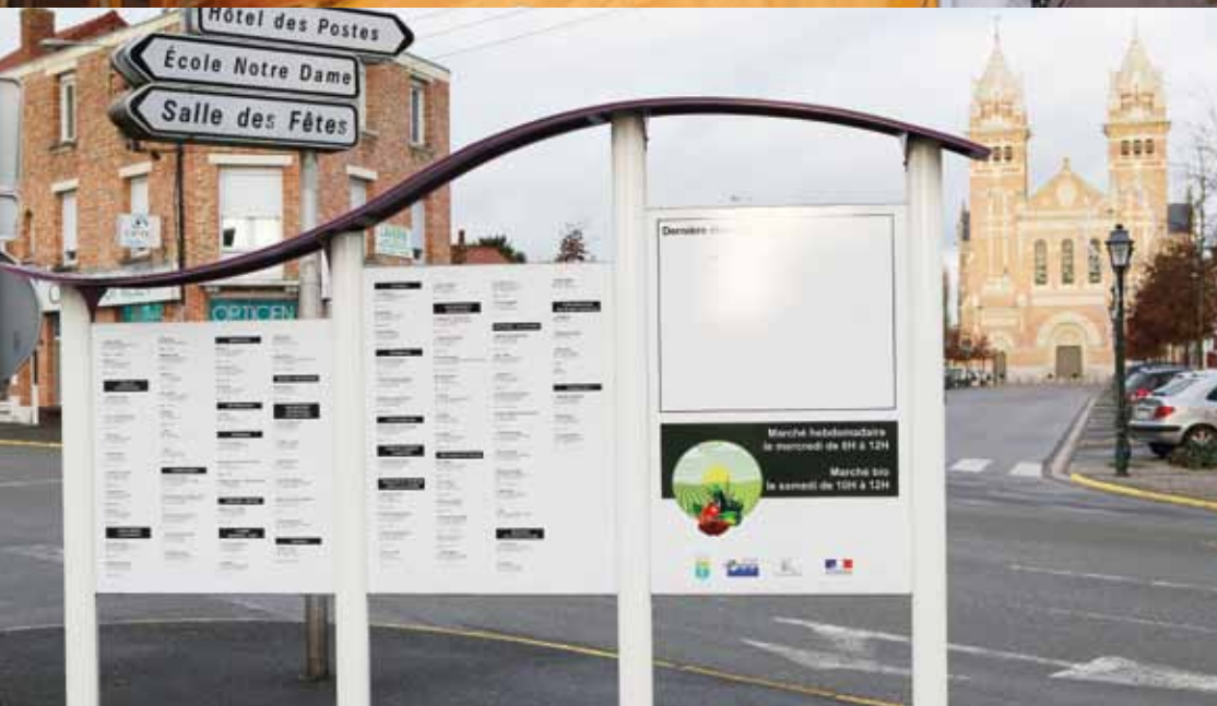
De 2000 à 2007, l'ancienne équipe a aidé 7 commerçants à hauteur de 7.763 € dans le cadre d'une action "commerces 2000" lancée par la CCI. De 2009 à 2013, notre équipe a réalisé un FISAC sur 4 ans, pour un montant total de 210.721 € (tranche 1 et 2) financés par la collectivité (aides au vitrine : 25 dossiers). En 2013, aide au démarrage (20.000 € budgétés : actuellement 16.000 € environ pour 8 dossiers).