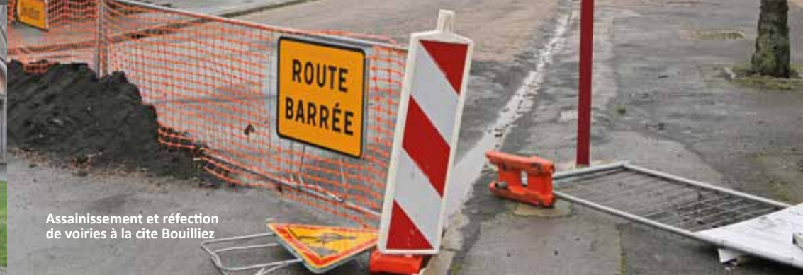
Assainissement et réfection de voiries à la cite Bouilliez