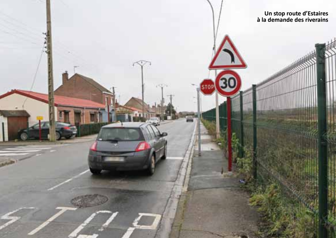
Un stop route d'Estaires à la demande des riverains