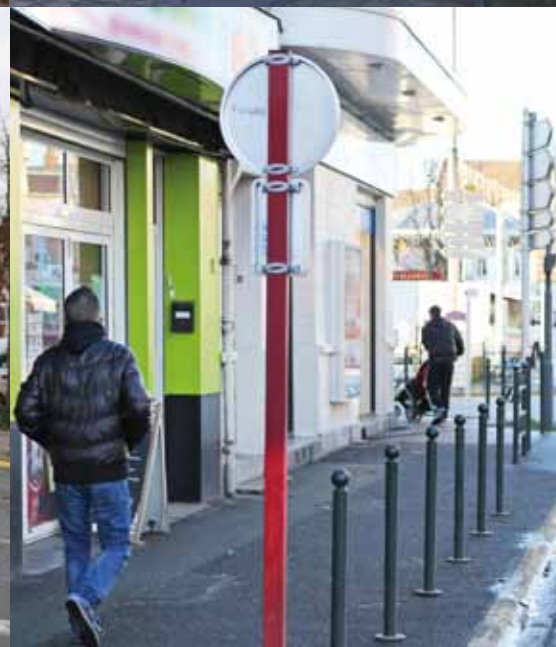
Des plots et un arrêt minute pour favoriser le commerce local