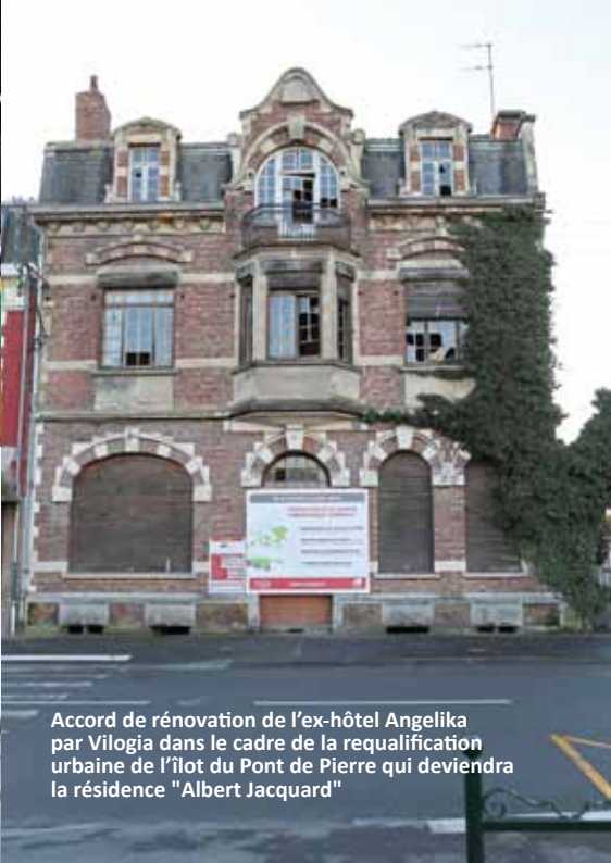
Accord de rénovation de l'ex-hôtel Angelika par Vilogia dans le cadre de la requalification urbaine de l'îlot du Pont de Pierre qui deviendra la résidence "Albert Jacquard"