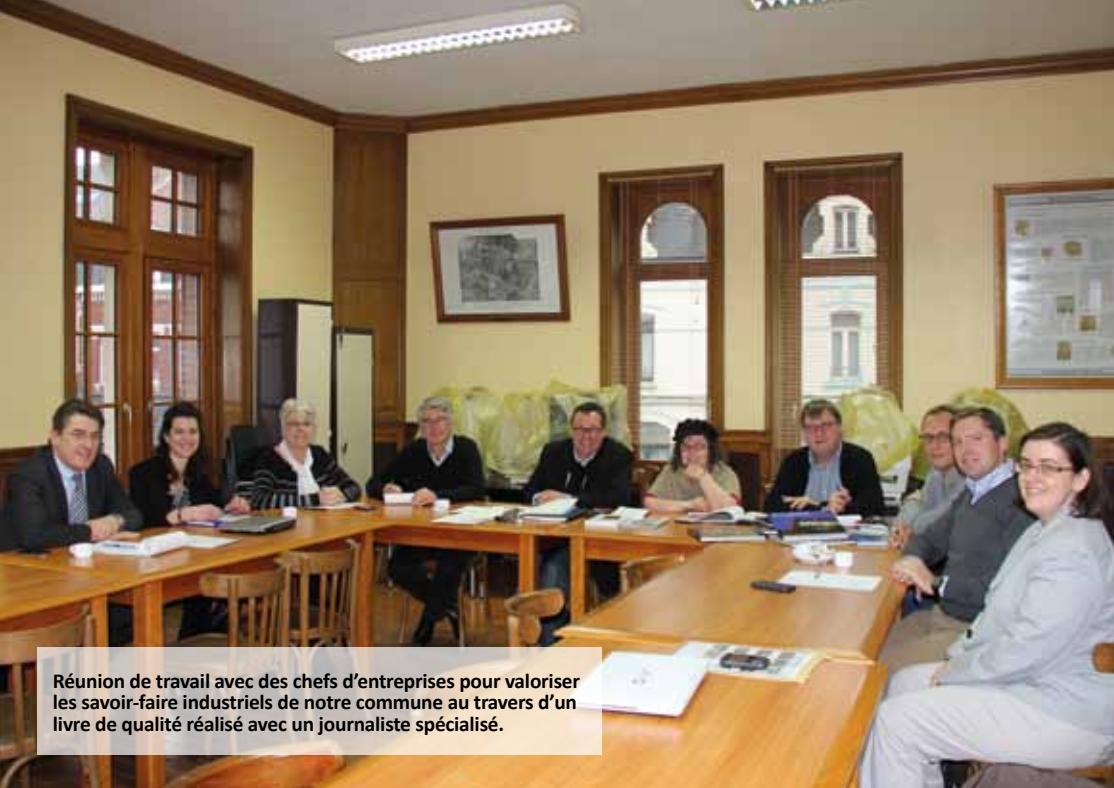
Réunion de travail avec des chefs d'entreprises pour valoriser le savoir-faire industriels de notre commune au travers d'un livre de qualité réalisé avec un journaliste spécialisé.