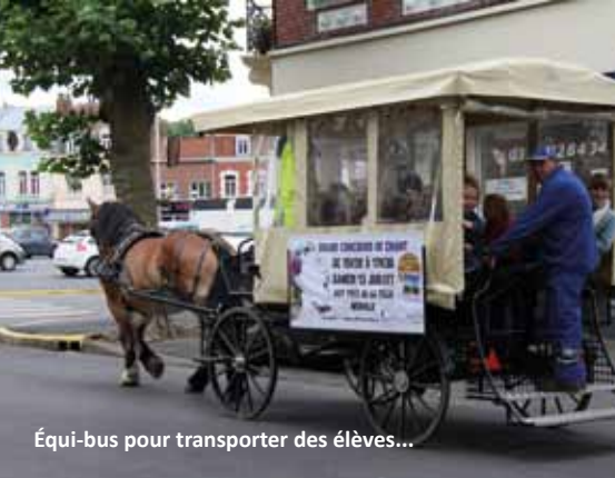
Équi-bus pour transporter des élèves...