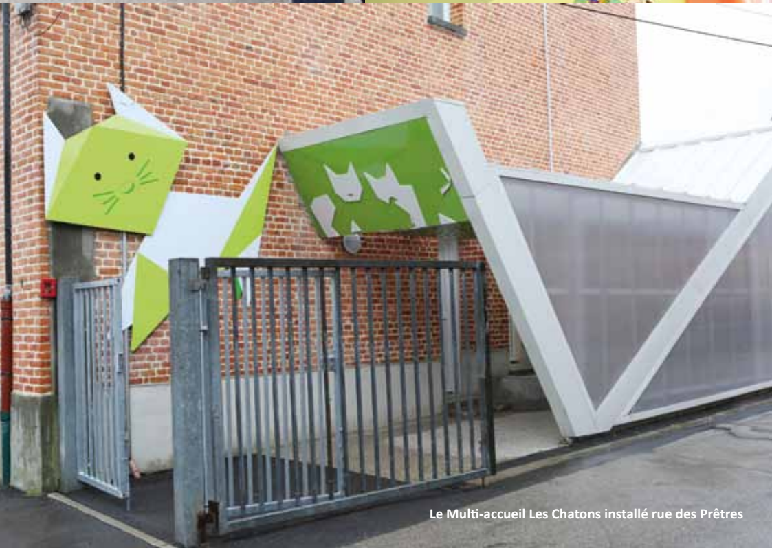
Le Multi-accueil Les Chatons installé rue des Prêtres