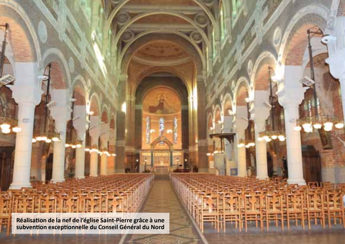
Réalisation de la nef de l'église Saint-Pierre grâce à une subvention exceptionnelle du Conseil Général du Nord