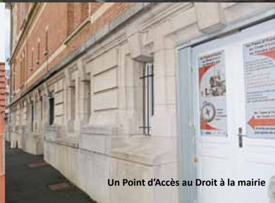
Un Point d'Accès au Droit à la mairie