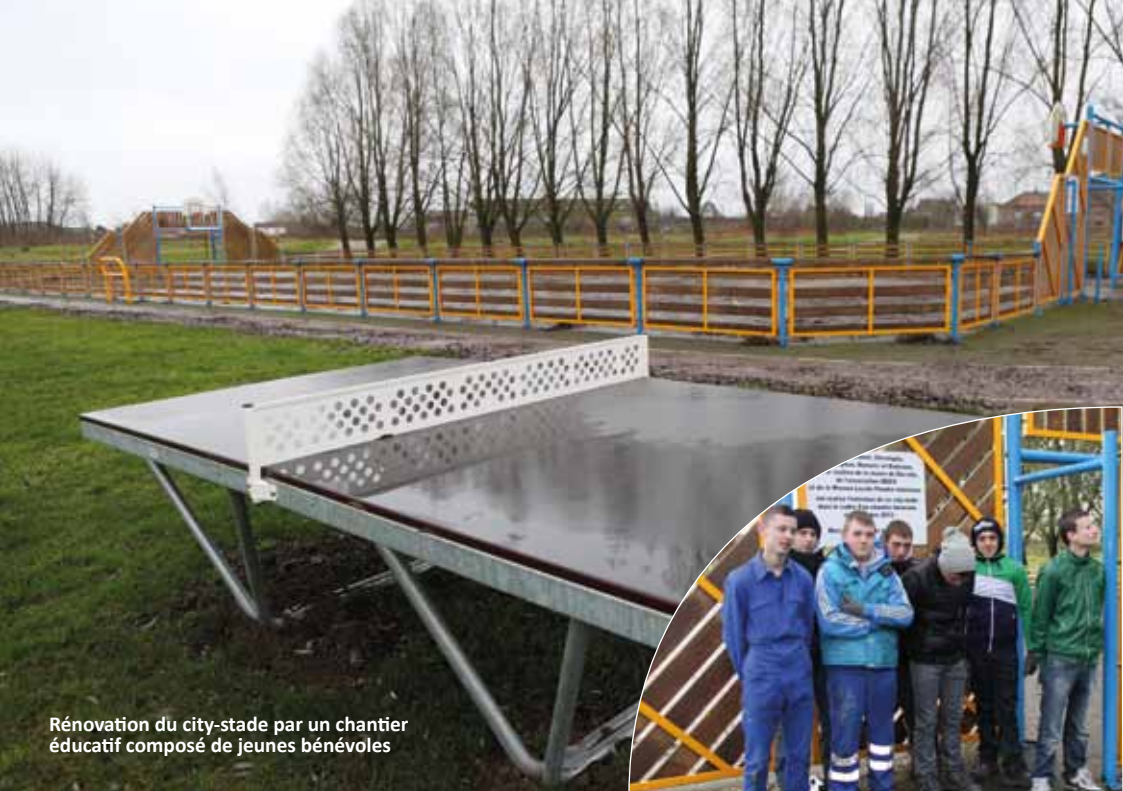
Rénovation du city-stade par un chantier éducatif composé de jeunes bénévoles