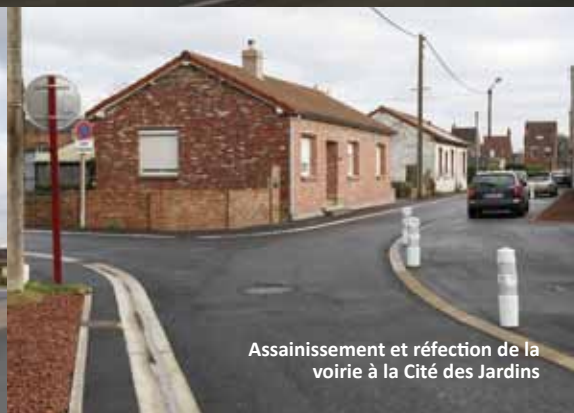
Assainissement et réfection de la voirie à la Cité des Jardins