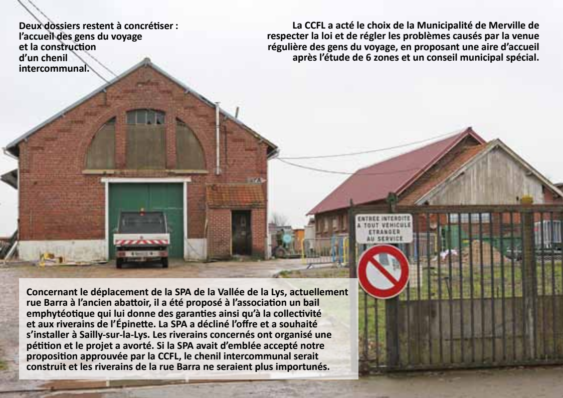
Deux dossiers restent à concrétiser : l'accueil des gens du voyage et la construction d'un chenil intercommunal.