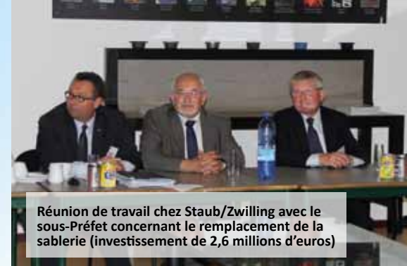
Réunion de travail chez Staub/Zwilling avec le sous-Préfet concernant le remplacement de la sablerie (investissement de 2,6 millions d'euros)