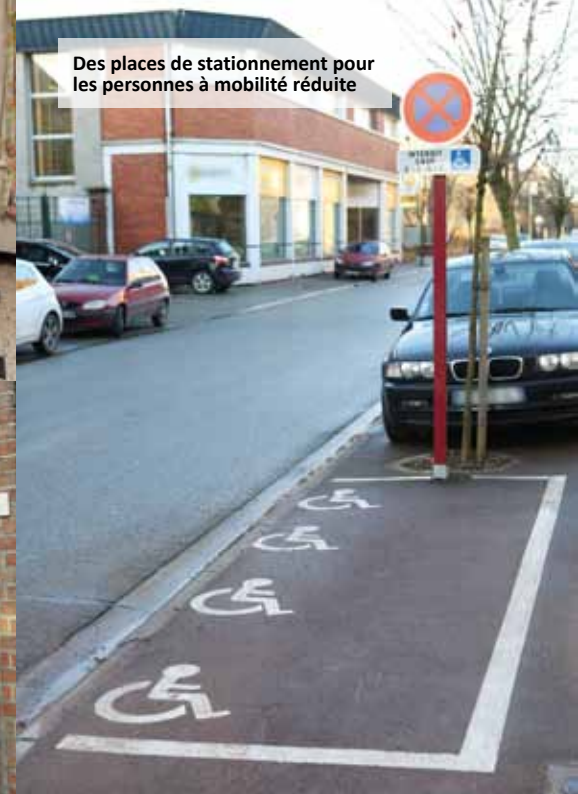
Des places de stationnement pour les personnes à mobilité réduite