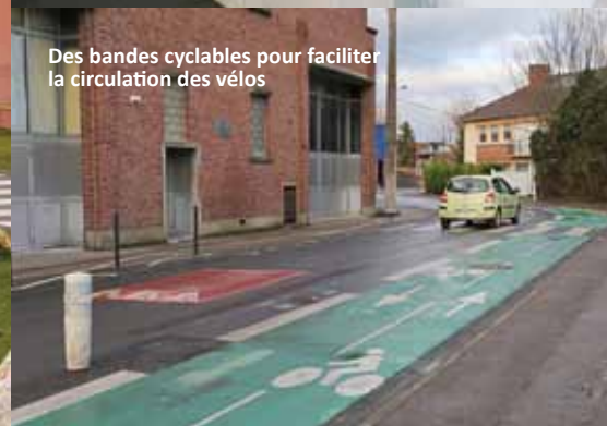
Des bandes cyclables pour faciliter la circulation des vélos