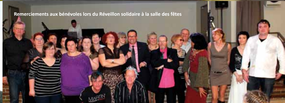
Remerciements aux bénévoles lors du Réveillon solidaire à la salle des fêtes