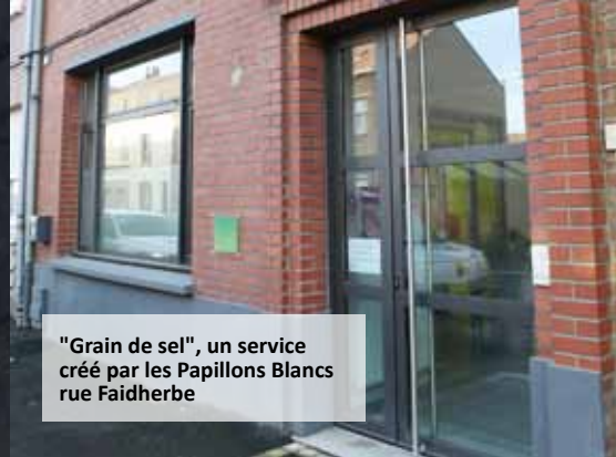
"Grain de sel", un service créé par les Papillons Blancs rue Faidherbe