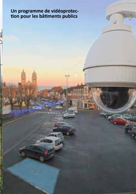
Un programme de vidéoprotection pour les bâtiments publics