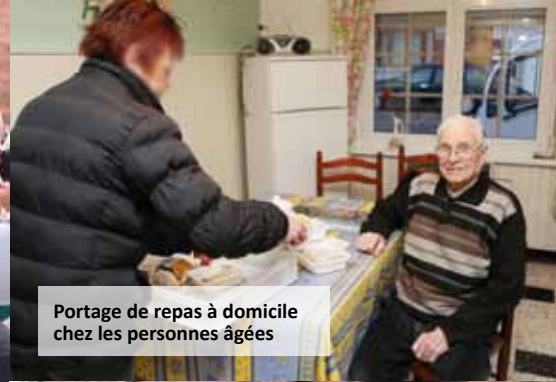
Portage de repas à domicile chez les personnes âgées