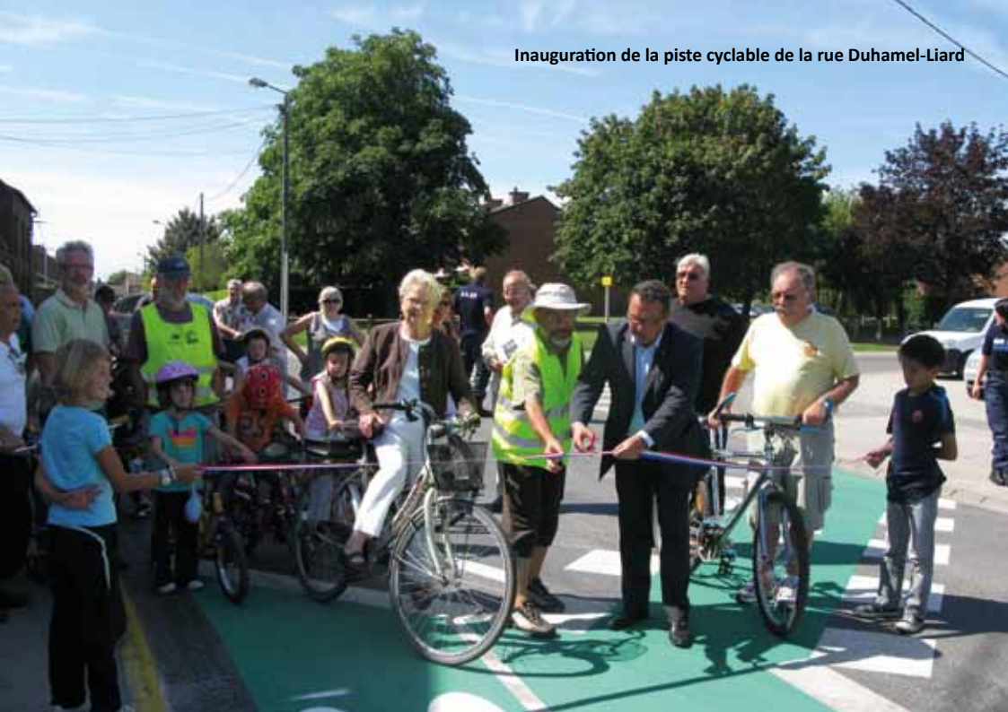
Inauguration de la piste cyclable de la rue Duhamel-Liard