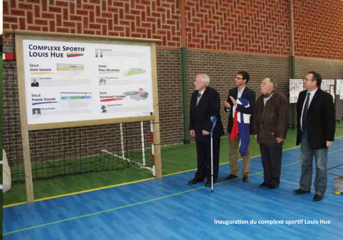
Inauguration du complexe sportif Louis Hue