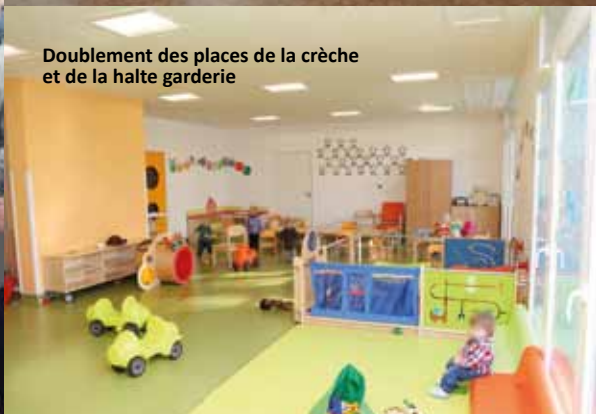
Doublage des places de la crèche et de la halte garderie