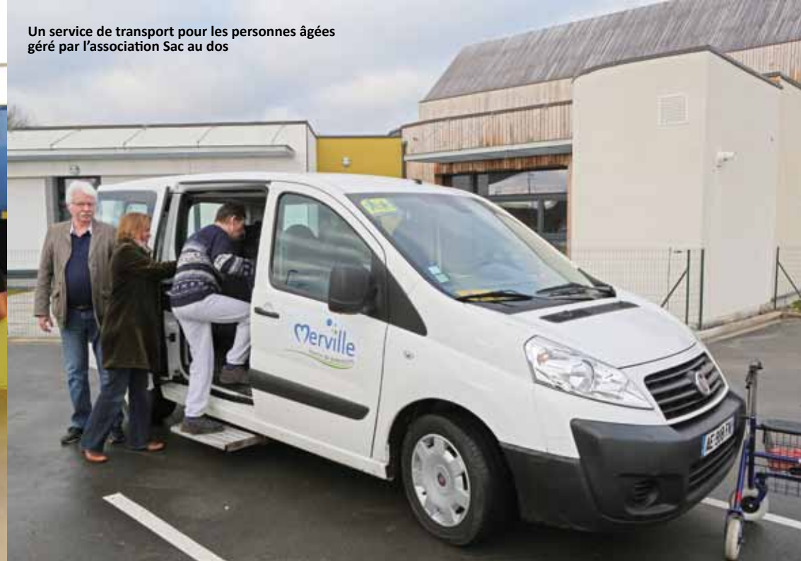
Un service de transport pour les personnes âgées géré par l'association Sac au dos