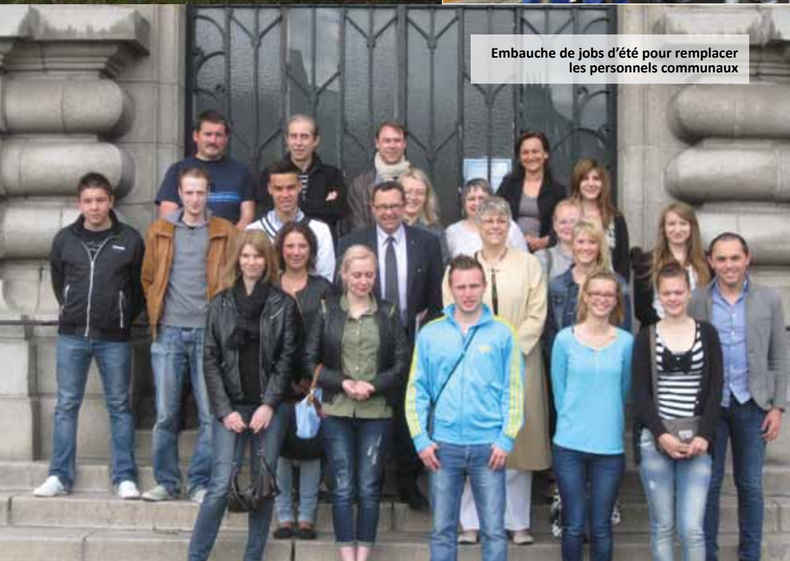
Embauche de jobs d'été pour remplacer les personnels communaux