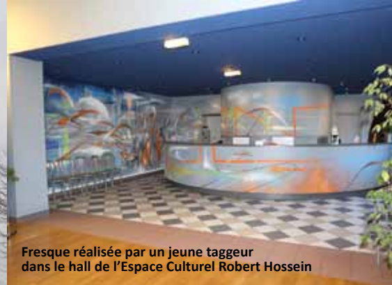
Fresque réalisée par un jeune tagueur dans le hall de l'Espace Culturel Robert Hossein