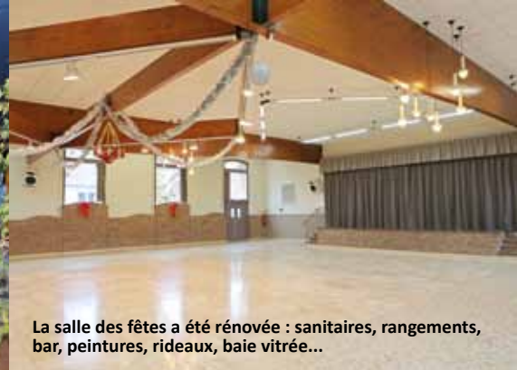
La salle des fêtes a été rénovée : sanitaires, rangements, bar, peintures, rideaux, baie vitrée...