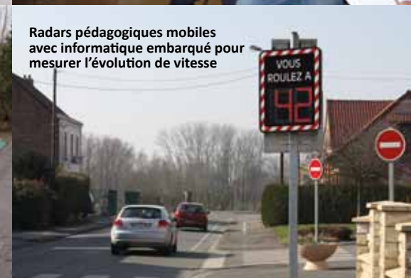
Radars pédagogiques embarqués avec informatique embarquée pour mesurer l'évolution de vitesse