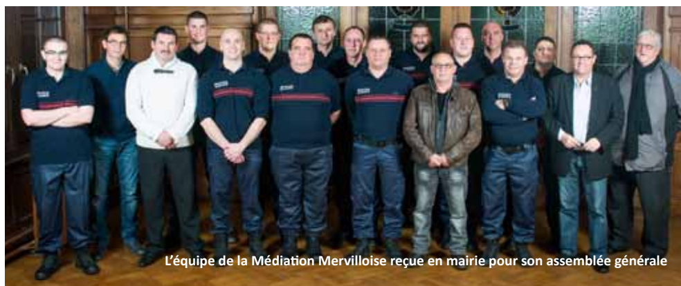
L'équipe de la Médiation Mervilloise reçue en mairie pour son assemblée générale