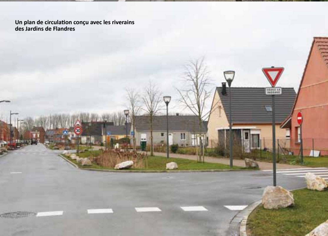
Un plan de circulation conçu avec les riverains des Jardins de Flandres