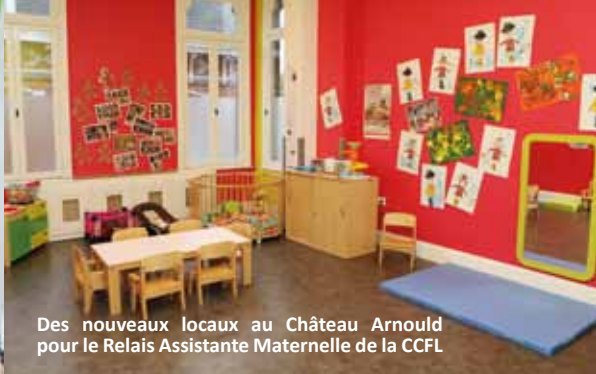
Des nouveaux locaux au Château Arnould pour le Relais Assistante Maternelle de la CCFL