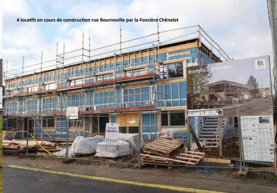
4 locatifs en cours de construction rue Bournoville par la Foncière Chênelet