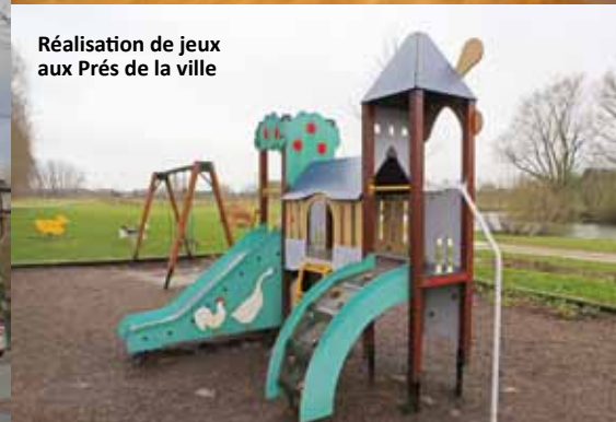
Réalisation de jeux aux Prés de la ville