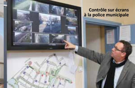
Contrôle sur écrans à la police municipale