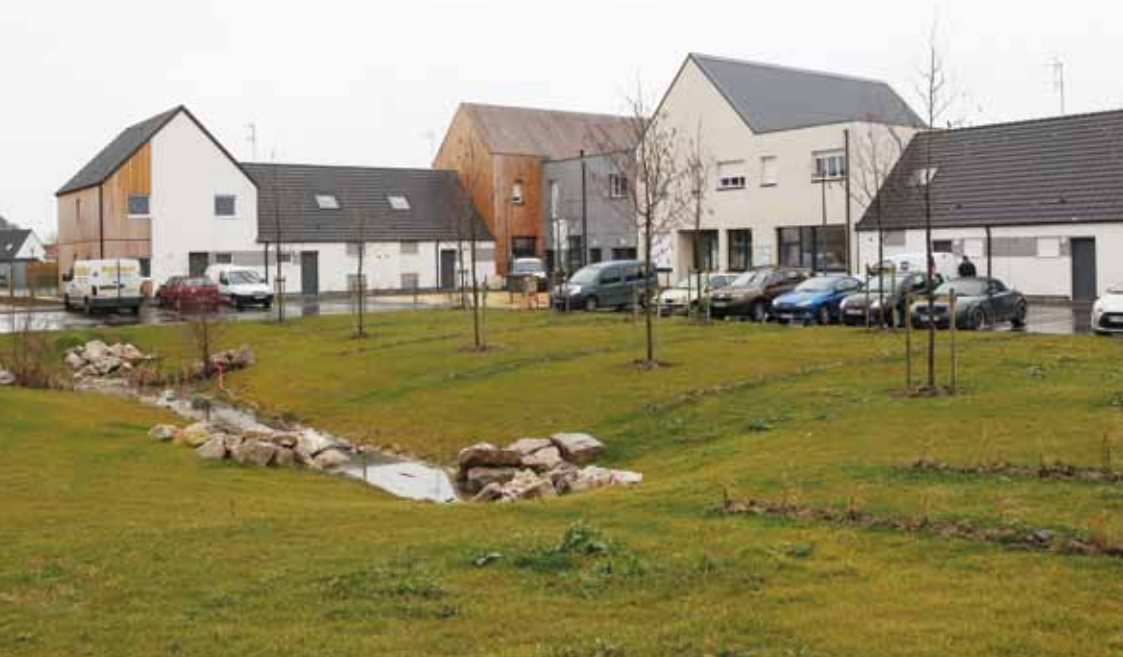
Construction de 20 locatifs place François Mitterrand par Vilogia