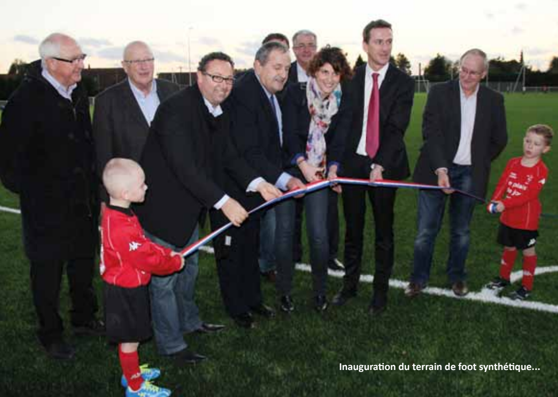
Inauguration du terrain de foot synthétique...